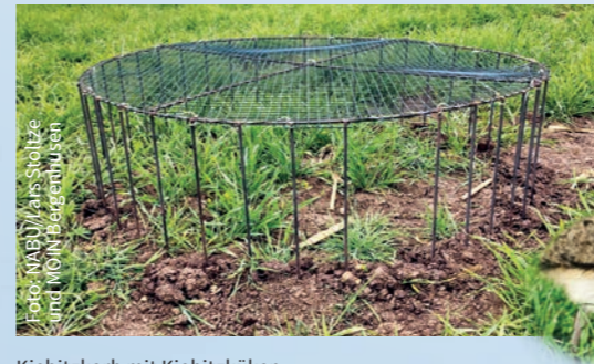
Kiebitzkorb mit Kiebitzküken