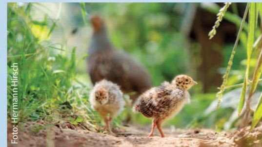
Rebhuhn mit Küken