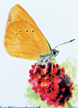
Dunkler Wiesenknopf- Ameisenbläuling